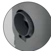
Austin 5 Speckstein, Korpus Stahl Schwarz