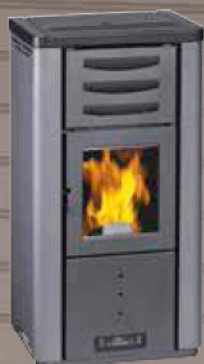
PO 57 ANTHRAZIT