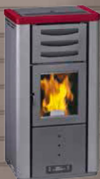
PO 57 BORDEAUX